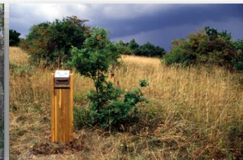
Site protégé du Holiesel et du Berg