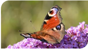
Paon du jour

Le haut des branches permet l'installation des nids de divers passereaux comme le Chardonneret élégant, le Verdier ou le Pinson des arbres. Au moment de la maturation des fruits, de nombreux insectes viennent s'y nourrir et s'y reproduire attirant ainsi des insectivores comme la Fauvette à tête noire et les chauves-souris.